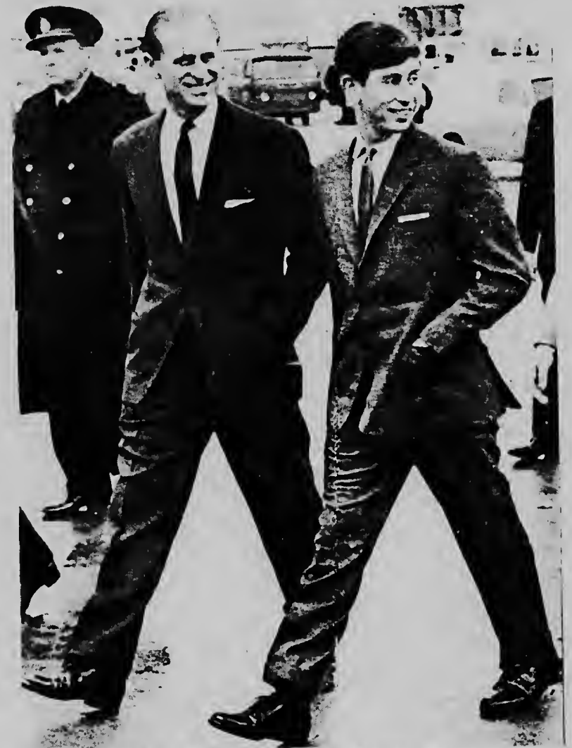
LONDRES--Riba e foto aki nos por mira Principe Charles y su tata Principe Felipe ta bayendo e avion cu lo hiba Charles Australia, caminda el lo sigui su estudionan. Anteriormente Charles a regresa cu su mama y ruman for di vacacion cu nan a pasa den exterior.

E editorial di "Diario del Pueblo" ta agrega cu e negativa di Johnson di reconoce e frente di liberacion nacional como e unico y legitimo representante di e 14 millon habitantenan di Vietnam del Sur, ta "espiritu di maldad cu tin miedo di luz di dia."